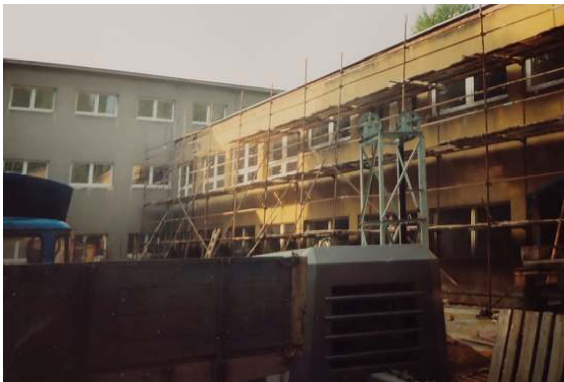
Generální oprava školy v roce 1997