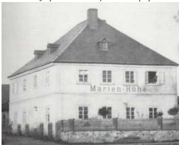
Farní škola Marien-Höhe

Historie školství v našich zemích prošla řadou změn, se kterými se školy musely vyrovnat. Věnujme se školám v Litvínově, kterých se uvedené přeměny samozřejmě také dotkly. Jedna z prvních zmínek o farní škole v Litvínově je připomínána k roku 1688 a patřila do areálu fary a kostela sv. Michaela archanděla. V letech 1736 – 1851 měla dvě třídy a od roku 1869 byla školou veřejnou. Postupným nárůstem obyvatel školní budova nedostačovala a byla nahrazena novou budovou. V roce 1877 po zrušení manufakturní výroby byla adaptována a následně v ní byla umístěna měšťanská škola chlapecká a dívčí, která sice byla označena jako německá, ale sloužila žákům německé i české národnosti. Ze statistiky z roku 1889 zjistíme, že do školy bylo zapsáno 186 českých dětí. V roce 1894 byla postavena vedle této budovy další školní stavba, která byla samostatnou obecnou a měšťanskou německou školou dívčí. Dnes ani jednu z původních historických školních budov ve městě nenajdete, protože byly zbourány. Na jejich místě je parkoviště za hlavní poštou v centru města.