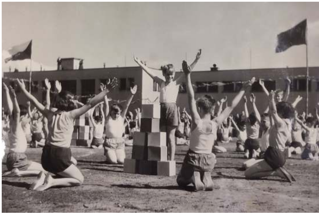
1. ročník školní spartakiády