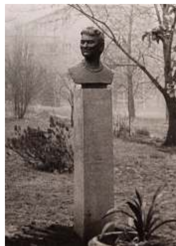
Busta Marie Majerové umístěná před školou