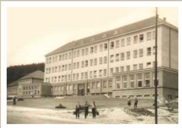
Nová školní budova 2. ZDŠ U Stadionu

V roce 1960 dochází na území Československa k reorganizaci republiky. Naše země dostává nový název Československá socialistická republika, změnila se Ústava a byl přidán nový bod o hlavní úloze KSČ. Dochází také k novému územně-správnímu uspořádání Československa a Litvínov přestal být okresním městem, jímž se nově stalo město Most. Novinkou začátku školního roku bylo, že školáci získali od vlády dárek - poprvé dostali učebnice a učební pomůcky zdarma. Pro naši školu znamenal nový školní rok úlevu v podobě přesunu poloviny žáků do nově otevřené budovy 2. ZDŠ U Stadionu (dnes Soukromá sportovní základní škola). Spolu s žáky přešla na školu i zhruba polovina učitelů působících dosud na naší škole. Výuka v dalších letech především v prvních třídách a případně s jednou druhou třídou probíhala od této doby ve Školičce (dnes školní družina). S novým školským zákonem byla zavedena 9. třída, která byla prvním rokem dobrovolná, posléze povinná. Na základě těchto změn skončilo směnové vyučování a také škola dostala nový název Základní devítiletá škola v Litvínově VI, který se začal používat od školního roku 1961/1962. Spolu s tím byla připravena i nová náplň práce a pro ni bylo použito motto „Spojení školy se životem“.