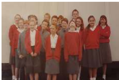
Výměnné pobyty žáků v Anglii i u nás

Školní život dostal novou energii a možnosti rozvoje. Téměř ihned v roce 1990 byla navázána spolupráce s anglickou školou Middle School v Pontelandu, která probíhala nejprve písemně a poté výměnnými pobyty žáků v Anglii i u nás. Následná výuka anglického jazyka byla rozšířena na aktivní konverzaci s rodilým mluvčím. Na škole se vystřídala celá řada mluvčích z Velké Británie, USA a Kanady, také Německa. Škola během let měla spolupráci se školami v Dánsku, Švédsku, Francii a Německu.