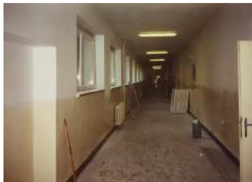
Generální oprava školy v roce 1997

Školní rok 1996/1997 byl pro naši školu opět velmi významný, Ne že by slavila výročí, ale jak roky přibývaly, tak nejen člověk, ale i budovy podléhají stárnutí a uvadají jejich krása a funkčnost. Ta naše školní byla v provozu více než čtyřicet let a potřebovala modernizaci. Opravy začaly již v květnu 1997 s tím, že práce, které by rušily výuku, byly přesunuty na prázdninové období. Oprava byla generální, protože se měnila okna, rozvody vody i elektroinstalace, byla obnovena střecha po celé ploše všech budov, provedena oprava a zateplení fasády a také proběhla generální oprava školní kuchyně. To vše stálo přibližně 24 milionů korun. Spolu s tím ovšem byly žákům prodlouženy prázdniny od půlky června do půlky září, kdy škola vyjela do školy v přírodě.