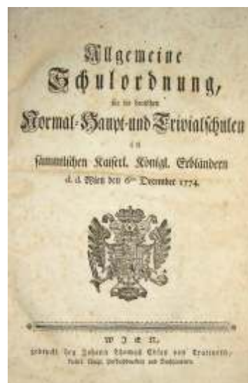
Titulní list školního řádu

Zmínili jsme, že chodit do školy nebylo v dřívějších dobách povinné, ale postupem času se i tento zvyk začal v evropských zemích měnit. Začátky povinné školní docházky byly spojené s koncem 16. století na německém území. Velkým vzorem pro ostatní státy v zavádění povinnosti výuky a školského systému se stalo Prusko, kde byla v roce 1717 uvedena povinnost výuky pro chlapce i děvčata. V českých zemích byla školní docházka zavedena v roce 1774 za vlády Marie Terezie, která se také inspirovala pruským školským vzorem a pověřila řízením školní reformy opata Johanna Ignaze Felbigera. 6. prosince 1774 byl vydán „Všeobecný školní řád pro všechny císařsko-královské země“, který stanovil mimo jiné všeobecnou vzdělávací povinnost pro chlapce i dívky, nikoli povinnou školní docházku, a byla zavedena šestiletá školní docházka a systém škol: 1) triviální školy na venkově i ve městech, při farázech, pro výuku čtení, psaní a počtů, výuku náboženství a základů zemědělství, pro dívky též domácích prací s výukou češtiny i němčiny, 2) hlavní školy ve městech, alespoň jedna v kraji. Kromě základních znalostí se učila též německá gramatika a latina. V českých hlavních školách se v prvním ročníku učilo česky, ve druhém částečně česky, ve vyšších německy, 3) normální školy. Ve stejném roce vychází i slabikář pro děti hlavních škol v německém jazyce a v roce 1775 v jazyce českém, který také zpracoval autor reformy J. I. Felbiger. Pro venkovské triviální školy je slabikář vydán až v roce 1817.