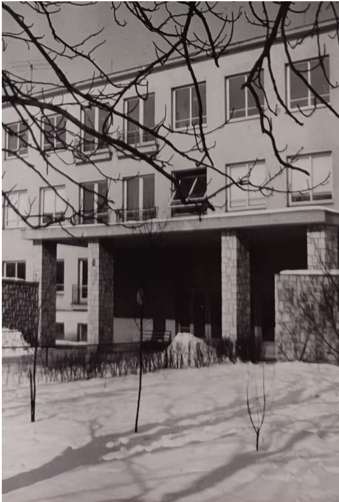
Foto školy v letech 1957 - 1958