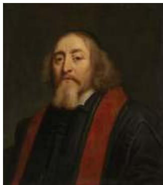
Jan Amos Komenský

farář nebo osoba, která absolvovala tříměsíční učitelský kurz a dost často byla pouze o kousek dále ve vzdělání než samotní žáci. Vzdělávání nebylo povinné, proto z velké části docházely děti do školy pouze v zimních měsících, kdy nemusely pomáhat na poli. Časté ovšem byly tělesné tresty a překážkou v efektivním procesu vzdělávání také velký počet dětí různého věku v jedné třídě.