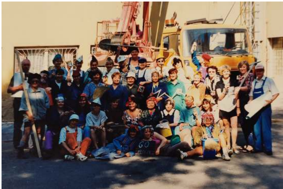
Na generální opravu byl připraven celý školní sbor