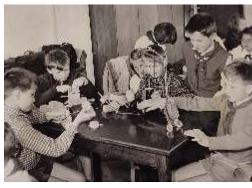
Různorodá činnost dětí ve školní družině