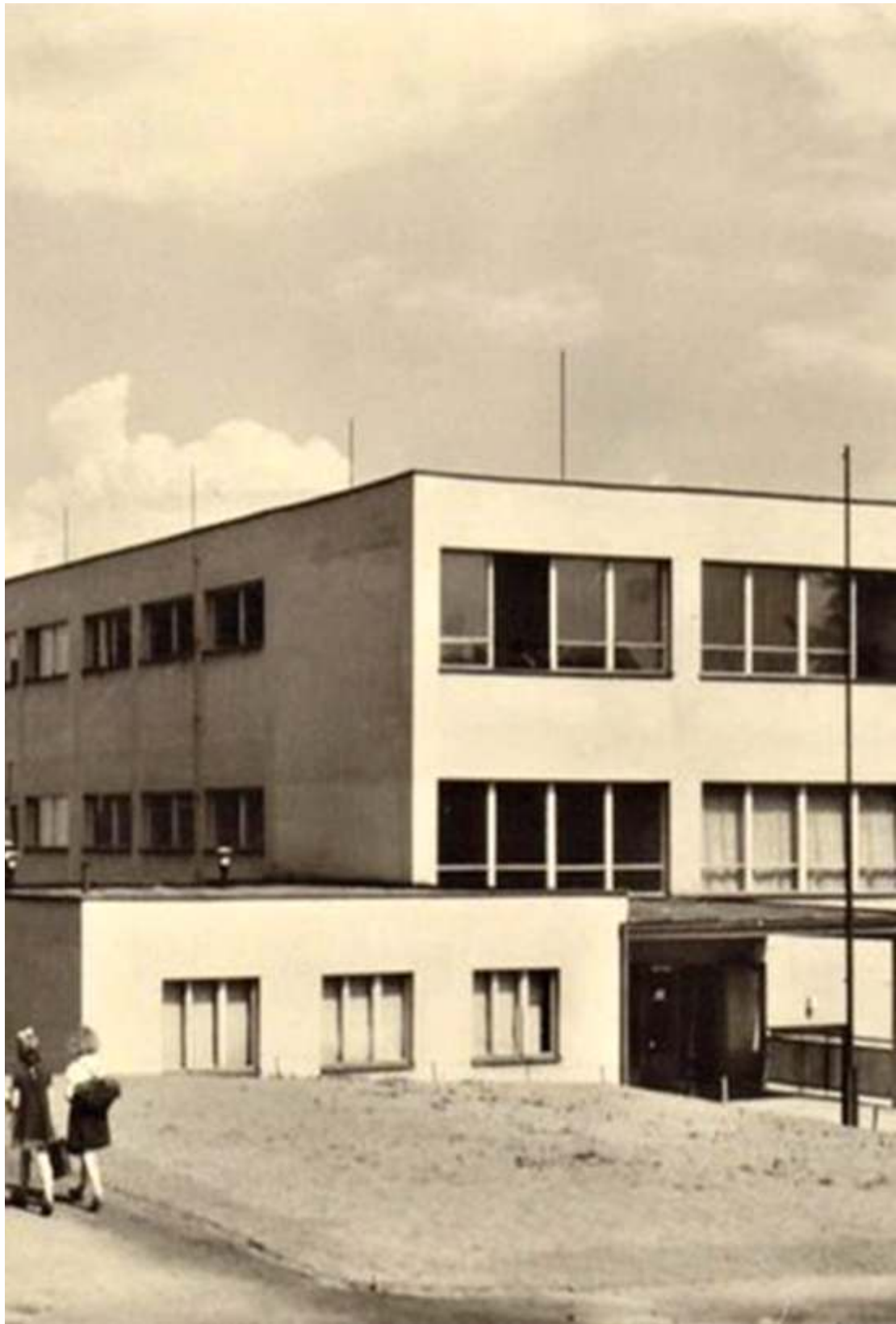
„Žlutá budova“, foto školy v letech 1951 - 1952