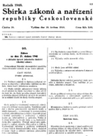
Titulní list školského zákona

Změna slova všeobecná vzdělávací povinnost na povinná školní docházka proběhla podle říšského školského zákona roku 1869. Začínala v 6 letech a trvala po dobu 8 let jak pro chlapce, tak i pro dívky. Novela říšského školského zákona z roku 1883 zavedla dělení základního školství na 2 stupně: školu obecnou a školu občanskou (měšťanskou). Obecné školy navštěvovaly děti v prvních pěti letech školní docházky (6–11 let) a v dalších třech letech děti, které nepokračovaly ve studiu na školách občanských nebo středních.