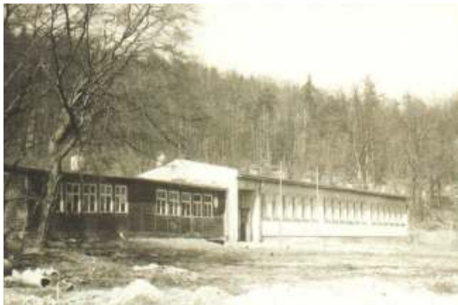
Provizorní dřevěná budova se zděnou přístavbou zv. „Myšárna“

Organizací škol v Litvínově se postupně dostáváme k počátkům historie naší školy, která vznikla doslova na zelené louce v severovýchodní části Osady. Na tomto místě začala výstavba moderní školy v roce 1949. Do té doby byla výuka dětí v budově, kde dnes stojí areál sportovní soukromé školy. Výuka zde začala v průběhu 2. světové války. Vzhledem k totální válce se v roce 1943 v další výstavbě Osady