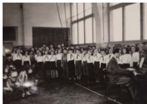
Školní pěvecké sbory