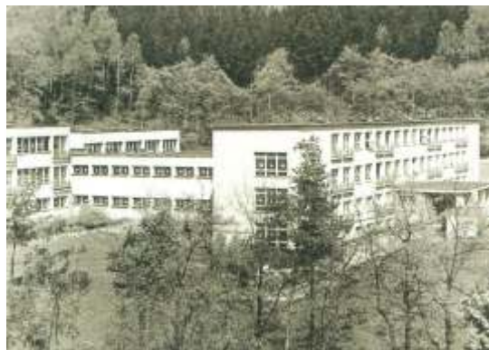
Komplex školních budov