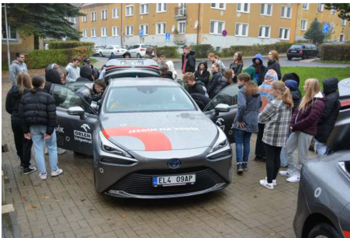
Představení vodíkového auta žákům školy

Nové místo v letošním roce získala školní knihovna (v přízemí modré budovy), kde společně s ní sídlí i opět otevřený školní klub.