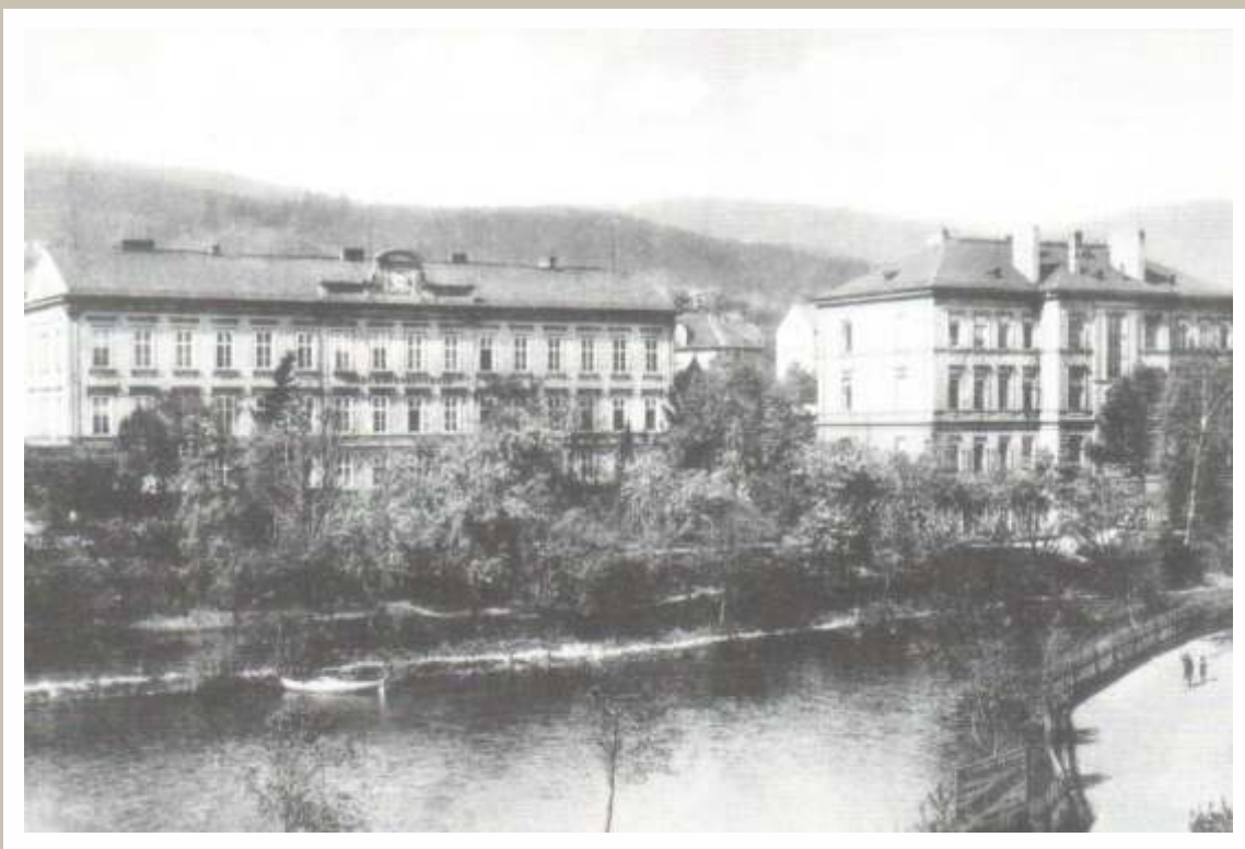
Budovy měšťanských škol chlapecké a dívčí