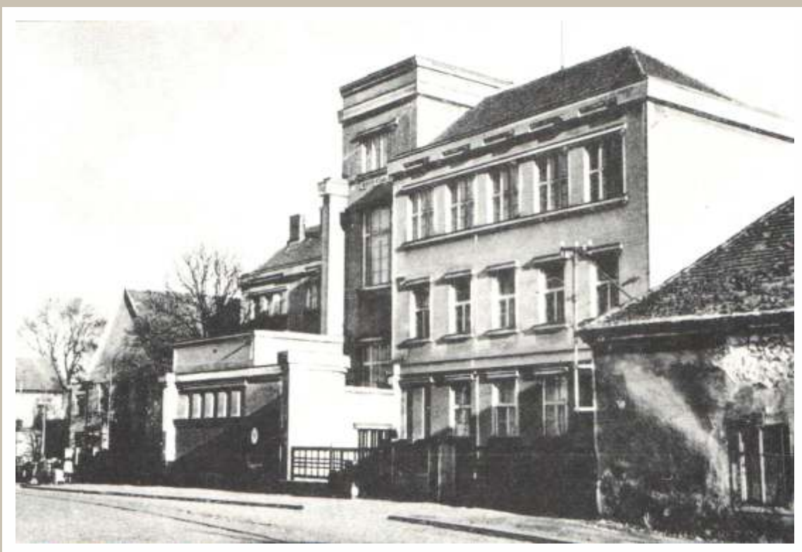
Školní budova gymnázia