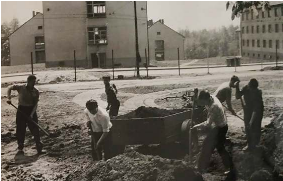
Výstavba nového školního hřiště

Netradičním majetkem školy byla chata na Klínech, kterou škola získala v 60. letech. V počátcích se jednalo o zanedbanou bývalou budovu lesní správy. Během let se svépomocí opravila a sloužila žákům i učitelům k různým rekreačním účelům. Dnes již v majetku školy není.