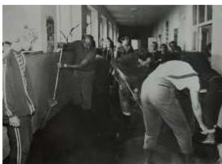
Následky havárie vodovodního řadu v prostorách školy v září 1976

Na začátku nového tisíciletí docházelo v městech, která zřizují základní a mateřské školy, ke změně v podobě slučování. Buď se jednalo o sloučení několika mateřských škol, nebo ke sloučení základní a mateřské školy. K naší škole byla ve školním roce 2001/2002 připojena mateřská škola v Ladově ulici. Důvodem slučování byly finanční úspory v provozních i personálních výdajích. Ředitel měl na starost nejen školu, školní jídelnu a školní družinu, ale také mateřskou školu. Název školy se opět změnil na Základní devítiletá škola s rozšířenou jazykovou výukou a Mateřská škola.